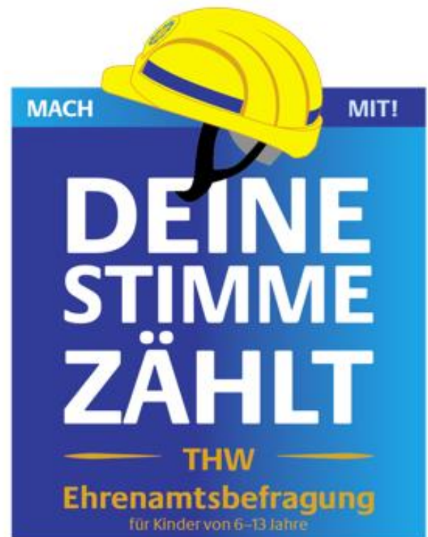
Logo der THW-Ehrenamtsbefragung für Kinder von 6 – 13 Jahre

Bei den Zugängen zur Befragung haben wir euer Feedback aufgenommen und möchten es hier direkt umsetzen. Für die Kinderbefragung arbeiten wir mit „offenen“ Links. Diese sind keiner Person zugeordnet. Jeder Link kann nur einmal verwendet werden.